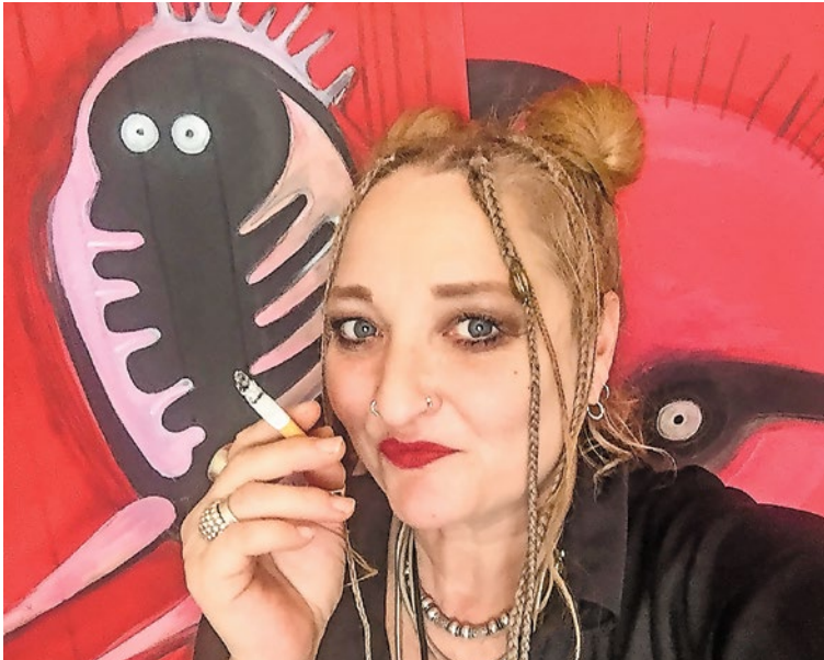
Eine kreative Seele vor ihren Monstern, Biestern und Bestien.